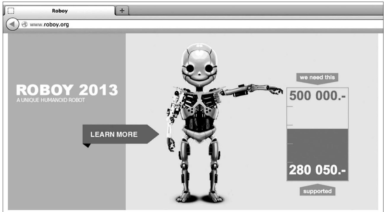
Sammeln für Roboy: Das Labor für künstliche Intelligenz der Uni Zürich will 500 000 Franken für einen Roboter.

Auf 2,8 Milliarden Dollar schätzt das britische Wirtschaftsmagazin «Economist» die weltweiten Einnahmen durch Crowdfunding in diesem Jahr; vor zwei Jahren waren es erst gut 500 Millionen. Typischerweise werden mit Crowdfunding Start-up-Unternehmen, kulturelle sowie soziale Projekte unterstützt. Über Kickstarter.com, die wichtigste Plattform in den USA, konnten für ein einzelnes Businessprojekt – die Pebble-Smartwatch – schon über zehn Millionen Dollar gesammelt werden. Ein Crowdfunding-Rekord wurde soeben aus der Branche der Computerspiele gemeldet: